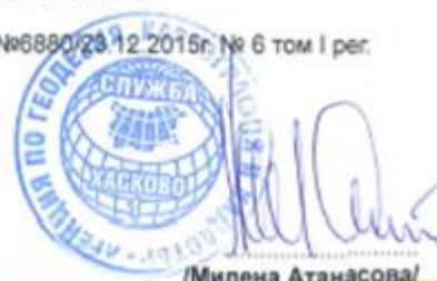
Схема № 15-987136-22.10.2020 г. издадена въз основа на заявление с входящ № 01-485111-20.10.2020 г.